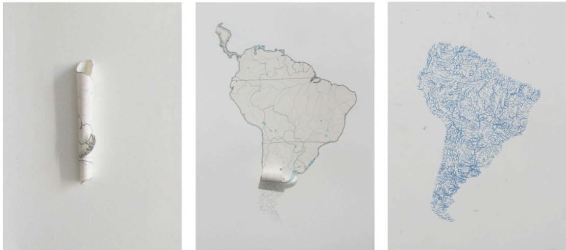
Alicia Herrero. Desvistiendo el terreno , 2016. De la serie El Viaje Revolucionario! . Tinta, lápiz y collage sobre papel. 35 x 79 cm

Las obras reunidas en la muestra abarcan más de cuarenta años y distintas generaciones artísticas. A pesar de la continua insistencia en la importancia de la cartografía y sus agudas críticas deconstructivistas, se notan también decisivos intereses generacionales, que reflejan las tensiones geopolíticas, sociales y culturales particulares a través de las décadas.