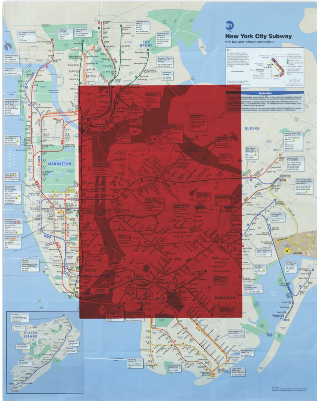
Horacio Zabala. Monocromo sobre New York , 2016. Tinta gráfica sobre mapa impreso. 74 x 58 cm