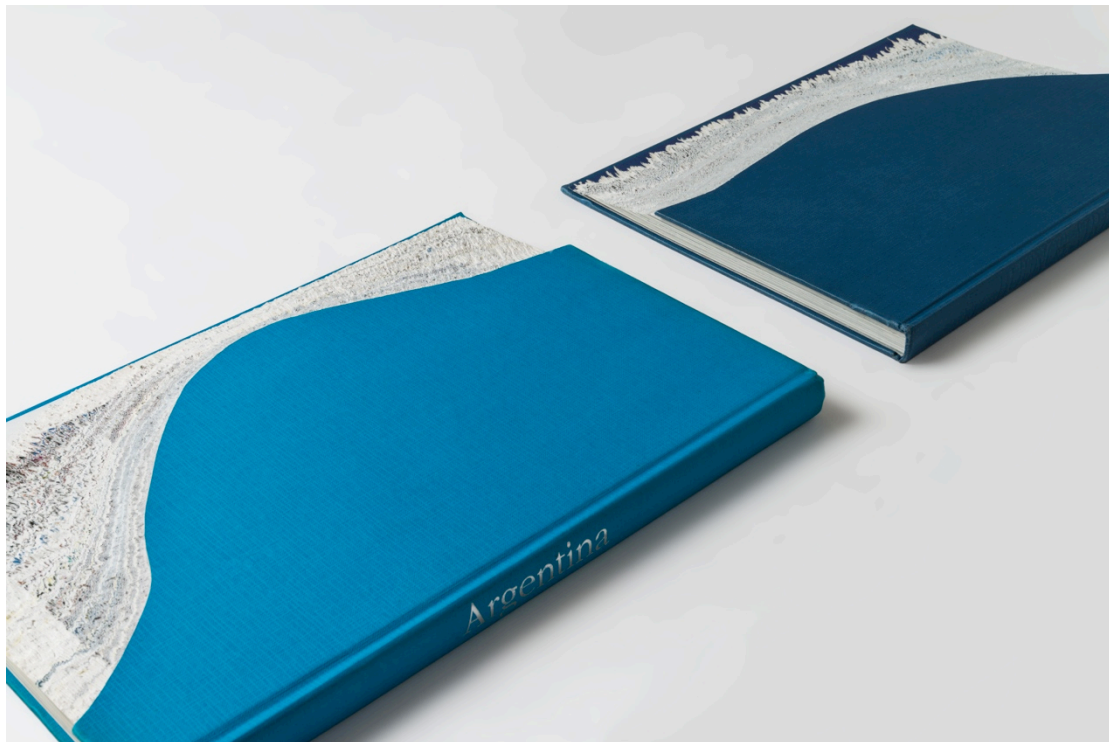
Luis Hernández Mellizo. Costa , 2017. 12 libros calados. Medidas variables. (Detalle)