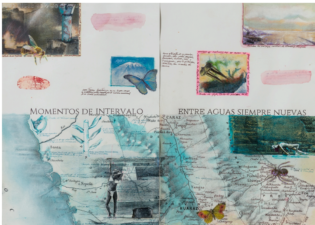
Rafael Hastings. Momento de intervalo. Entre aguas siempre nuevas , 2016. De la serie Dibujos mentales . Grafito, lápiz color, tinta y témpera sobre papel. 42 x 59 cm

Aunque el arte de la época de los setenta está firmemente asociado con los conceptualismos ideológicos y su giro político, al mismo tiempo se empieza a concretar el otro tipo de conciencia y preocupación, la cual parece dominar las obras de artistas más jóvenes. En tal sentido, esta conciencia del alcance global, de la porosidad permanente y absoluta de las fronteras, de su carácter violentamente impuesto, se manifiesta de manera casi profética en las obras de Nicolás García Urriburu. Su World Water Environment (Ambiente acuático mundial) pretende abarcar y unificar todas las aguas del mundo. Imaginemos que su característico pigmento verde jade se desplaza empezando con los mares, poco a poco penetra los ríos y fluye hasta los más pequeños arroyos, para finalmente desaparecer y reunirse con la tierra. Este ambiente comprende todo, todo lo que podemos imaginar y designar.